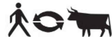
Konzept und grafische Gestaltung:

In den letzten Jahren werden Heckrinder vermehrt im Naturschutz eingesetzt. Sie können ganzjährig im Freien gehalten werden und betreiben Biotoppflege als „Rasenmäher ohne Spritzenbrauch“. Angesichts drängender Probleme in der Tierhaltung sowie im Arten- und Biotopschutz stellen solche Beweidungsformen eine hochwertige Alternative dar und tragen zur Produktion gesunder Nahrungsmittel und Erhaltung einer vielfältigen Kulturlandschaft bei.