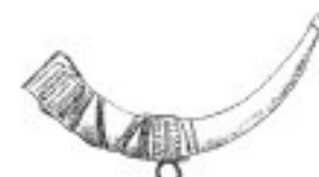
Das Horn des Auerochsen wurde mit Gold und Silber verziert und bei Festlichen Anlässen als wertvolles Trinkgefäß verwendet.