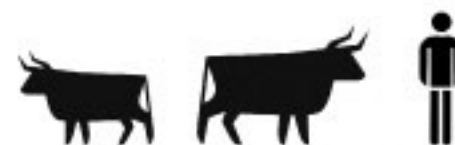
Der Geschlechts-Dimorphismus des Auerochsen war der Grund, wieso man die kleineren weiblichen Tiere früher als eigene Art beschrieb. Erst Anfang des 20. Jahrhunderts erkannten bahnbrechende Archäologen diese Art an.

Der Mensch spielte in dieser vorzeitlichen Umwelt nur eine Nebenrolle. Über 99 Prozent seiner Evolution lebte er als Jäger und Sammler. Der Auerochse war eine wertvolle Jagdbeute, doch ein genauso gefährlicher Gegner. Mit Speerspeeren und Holzlanzen stand man Auge in Auge mit dem schnaubenden Ungeheir, in Fallgruben oder mit Fangsteinen versuchte man es zu überlisten. Häufige Verletzungen und Brüche gefundener Menschenknochen stellen die Wehrhaftigkeit dieses Wildrindes unter Beweis. Kraft und Energie des Urindes wurden sprichwörtlich, der Auerochse schließlich zum Kultobjekt.