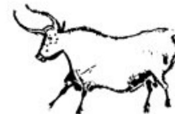
Auerochse aus Lascaux Alter etwa 18.000 Jahre

Die Höhle von Lascaux in Frankreich liefert uns ein Zeugnis der vorzeitlichen Verehrung des Auerochsen. Neben Wisent, Wildpferd und Rentieren bedeckten mehr als 50 Darstellungen von Urindern die Höhlenwände. Es sind 18.000 Jahre alte Bildergeschichten, geschaffen aus einfachsten Erdpigmenten von steinzeitlichen Jägervölkern - brillant und leuchtend, als wären sie gestern erst entstanden. Dieses Gesamtkunstwerk gehört zu den faszinierendsten Stationen des Menschen auf seinem Weg zum Kulturwesen. War die Bildhöhle ein Ort kultischer Jagdmagie und Initiationsriten? Eine Hochschule für junge Steinzeijäger? Oder Lebenswerk eines Schamanen und Künstlers?