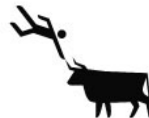
Am römischen Könighof auf der Insel Kreta pflegte man vor 3.500 Jahren die Tradition des Stierpraggen. Rind-Aktivisten wurden auf die Hörner geworfen und ließen sich eines Salts auf dem Rücken des Stiers.